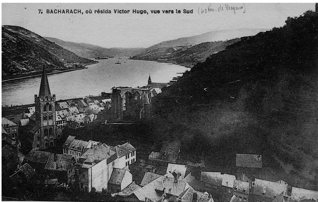
Postkarte mit einem Bild von Bacharach

Diese alte Feenstadt, wo es von Sagen und Legenden wimmelt, wird von einem malerischen Schlag von Einwohnern bewohnt, die alle, die Alten und die Jungen, die Kinder und Großväter, kropfige und schöne Mädchen, in ihrem Blick, in ihren Zügen und in ihrer Haltung etwas haben, das an das 13. Jahrhundert erinnert. Das hindert aber die schönen Mädchen keineswegs sehr hübsch zu sein. (...) Bacharach liegt in einer wilden Gegend. Wolken, fast immer über seinen Ruinen hängend, jähe Felsen und ein wilder Felsbach umgeben würdig die alte ernste Stadt, die einst römisch, dann romanisch gewesen, endlich gotisch geworden, aber nicht modern werden will.“