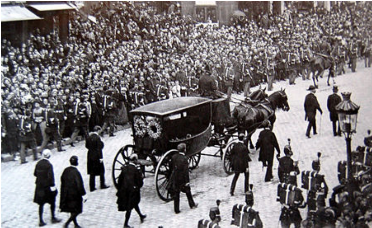
Auf dem Weg zum Panthéon zur Beisetzung von Victor Hugo

Die Rheinromantik erreicht in „Le Rhin“ ihren Höhepunkt und gilt bis heute als Klassiker. Dennoch geriet das Werk bald in Vergessenheit und war in Frankreich jahrzehntelang nicht mehr im Buchhandel erhältlich. Erst 1981 wurde es wieder neu aufgelegt. 1982 erschien eine vollständige Ausgabe in Deutschland, die aber inzwischen wieder vergriffen ist. Die Eröffnungsfahrt der preußisch-rheinischen Dampfschiffahrts-Gesellschaft, Köln im Jahr 1827 war der Anfang einer neuen Ära des Reisens. James Cook begründete um 1842 seine moderne Touristikindustrie, die im Widerspruch zum einsamkeitssuchenden Reisenden stand. Mit Victor Hugo geht die romantische Rheinreise zu Ende. Massentourismus und Romantik schließen sich aus.