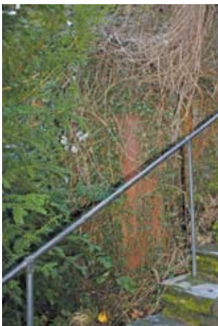
Verwitterte Grabplatte am Aufgang zur Wernerkapelle.

der Viertälergemeinde einnahm, baute diese in den folgenden Jahrzehnten weiter aus. So wird der Ort zusammen mit Diebach (Oberdiebach) 1254 unter den Mitgliedern des Rheinischen Städtebundes genannt. Jedoch erst 1356, nach der Errichtung der Stadtmauer, wird Bacharach als Stadt angesehen und auch als eine solche benannt. Schon früh entwickelte sich der Ort aufgrund seiner geographischen Lage zu einem wichtigen mittelhessischen Handels- und Stapelplatz. Bacharach war Umschlagplatz für pfälzische und rheingauische Weine sowie für Holz, das vor allem vom nahen Hunsrück kam. In Bacharach befand sich auch eine Zollstätte. Dieser erstmals 1226 genannte Zoll, der im Besitz der Pfalzgrafen war, gehörte zu den ertragreichsten Zöllen im Rheintal. Mit der Zunahme des Schiffverkehrs im späten Mittelalter und der Sachkenntnis, die eine Zollverwaltung erforderte,