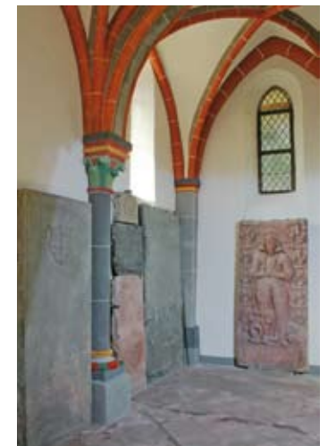
Blick ins südliche Seitenschiff.

Dank zu sagen ist der evangelischen Kirchengemeinde St. Peter in Bacharach für die Erlaubnis, die Denkmäler zu untersuchen und zu fotografieren. Hilfe beim Nachweis der Personengewährten