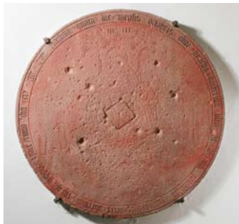
Kreisrunde Sandsteingrabplatte der 1467 verstorbenen Katharina Pletz (vgl. Nr. 4)

nur noch von kleinen Baumaßnahmen, wie dem Anbau einer barocken Sakristei berichtet. Nach der zweiten Hälfte des 19. Jahrhunderts waren dann, bedingt durch den schlechten Erhaltungszustand, mehrere Restaurierungen notwendig.