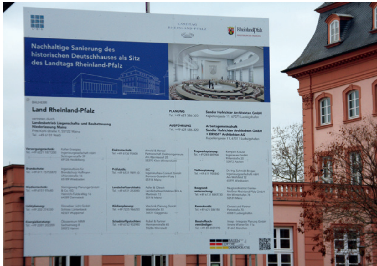
Abb. 7: Baustelle Landtag (Foto: © Landtag Rheinland-Pfalz / Torsten Silz).

den Erfahrungen mit der Guillotine, dem Terror und der Vernichtung während der Französischen Revolution prägten in Deutschland in besonderer Weise das kollektive Gedächtnis. Darüber sollte aber nicht in Vergessenheit geraten, dass auch in den Jahrhunderten zuvor Menschen bereit waren, zur Erlangung und Verteidigung von Freiheitsrechten zu den Waffen zu greifen. Aufstände und Revolten waren der vormodernen Gesellschaft auch in jenen Landschaften, die zum modernen Staat der Deutschen zählen, mental und strukturell gleichsam eingeschrieben. Die Ausbildung des staatlichen Gewaltmonopols in der Moderne führte dazu, dass die Anwendung von Gewalt ausgehandelten Regeln unterlag und sie – von der Notwehr abgesehen – mit Verboten und Strafen belegt wurde. Gewalt ist allerdings in ihren vielfältigen Erscheinungsformen keineswegs, wie oft suggeriert und von vielen erhofft wurde, aus der Moderne verschwunden; historisch und weltweit gesehen ist sie omnipräsent. Die ihrerseits oftmals erkämpfte Konzentration von Gewalt bei staatlichen Institutionen ist ein hohes Gut und eine unverzichtbare Grundlage menschlichen Zusammenlebens in modernen Demokratien. Aber auch sie bedarf ständig der Legitimierung sowie der Recht-