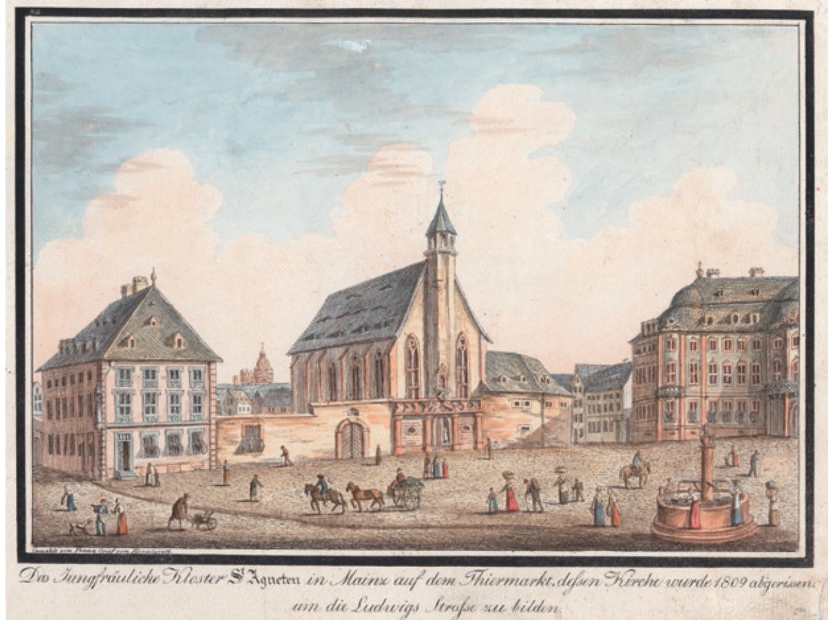
Unten Abb. 4: Kloster St. Agnes.