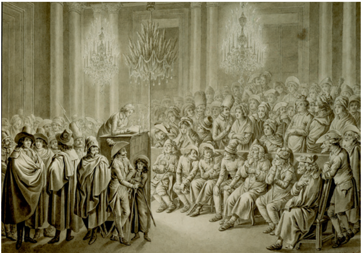
Abb. 1: Versammlung des Mainzer Jakobinerklubs im kurfürstlichen Schloss. Lavierte Federzeichnung.

* Zu Nachweisen von Quellen und Literatur vgl. Michael MATHEUS, Die Mainzer Republik – Französischer Revolutionsexport, deutscher Demokratieversuch, Mosaikstein einer europäischen Freiheitsgeschichte. In: Hans Berkessel, Michael Matheus, Kai-Michael Sprenger (Hgg.), Die Mainzer Republik und ihre Bedeutung für die parlamentarische Demokratie in Deutschland (Mainzer Beiträge zur Demokratieggeschichte 1). Mainz 2019, S. 14–33.