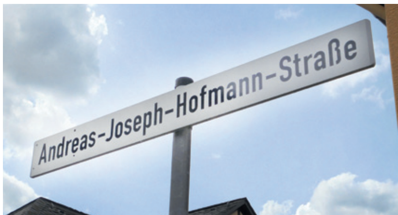
Rechts Abb. 12: Straßenschild in Winkel.