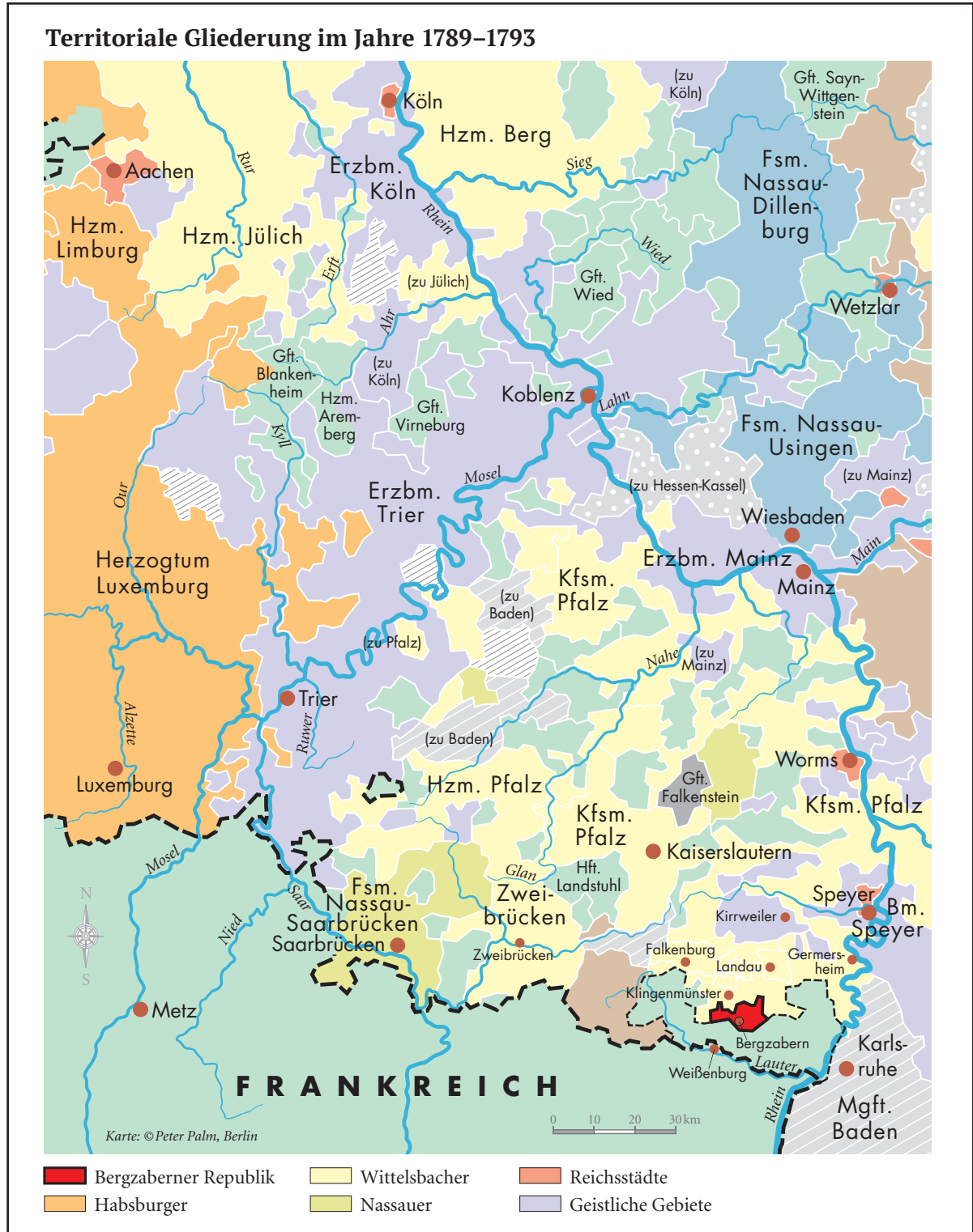
Abb. 5a u. b: Die Bergzaberner Republik (Karte: Palm / Matheus).

knüpft. Die Geschichte von Freiheiten, Formen der Repräsentation und Partizipation beginnt vor allem unter wahrnehmungs- und rezeptionsgeschichtlichen Aspekten eben nicht erst mit der Französischen Revolution. Dies war den Mainzer Jakobinern offensichtlich mehr bewusst als uns heute.