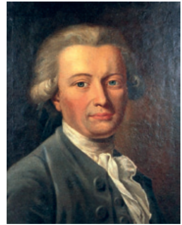
Oben Abb. 2: Georg Forster. Gemälde von Johann Heinrich Wilhelm Tischbein (1751–1829), vermutlich 1785.