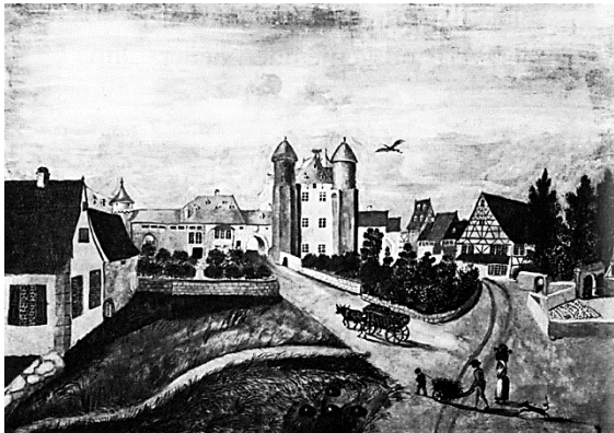
"Vue de Chateau de Niederohlm", Gemälde von Nanette Beatz. 3

Das Vorhaben kam zur Ausführung. Auf dem Gemälde von Nanette Beatz, das noch kurz vor dem Teilabriss des Schlosses entstand, ist neben dem Tor des Haupteingangs, vor dem Wohntrakt mit Erker, die Lindenallee zu sehen.