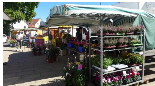
2020, Wochenmarkt auf dem Rathausplatz. 7

Das Hofgut von Jacob Krätzer und seinen späteren familiären Nachfolgern überstand alle Zeiten, bis die Gemeinde 1959 das Anwesen, einschließlich der noch beachtlichen Reste der Laurenziburg , erwarb. Im gleichen Jahr begann die Niederlegung der baulichen Anlagen. 6 Das nun große freigewordene Areal bot nun Platz für den Neubau des Rathauses für die Verbandsgemeinde- und Stadtverwaltung Nieder-Olm. Der heutige attraktive Rathausplatz mit gastronomischem Umfeld und Marktgeschehen wurde 2009 fertiggestellt.