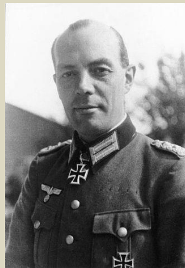
Abb. 2. Oberst von Gersdorff. 12

1923 beginnt Rudolf-Christoph Freiherr von Gersdorff , der aus einer schlesischen Offiziersfamilie stammt, nach dem Abitur seine militärische Laufbahn im Reiterregiment 7 der Reichswehr (Abb. 2).