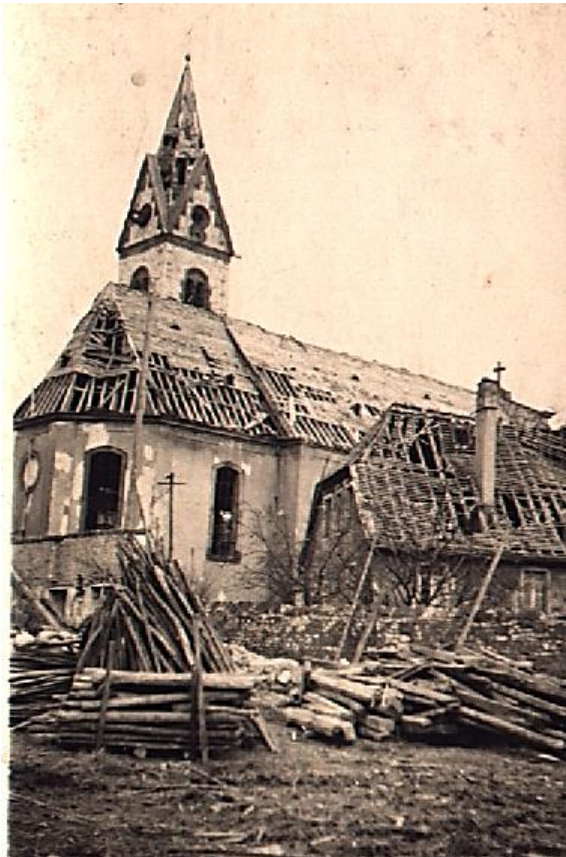
Abb. 1. Die katholische Kirche nach dem Luftangriff im Februar 1945. 2

Für die rheinhessische Gemeinde Nieder-Olm ging er Zweite Weltkrieg nach einem heftigen Kampf zwischen deutschen und amerikanischen Truppen am 20. März 1945 zu Ende. Durch den Erdkampf und die vorangegangenen Luftangriffe waren beträchtliche Gebäudeschäden entstanden 1 : 46 Häuser waren total zerstört und 221 teilweise zerstört (Abb. 1). Der nachfolgende Bericht soll vor allem die örtlichen Kampfhandlungen zwischen deutschen und amerikanischen Truppen sowie das Verhalten der Bevölkerung darstellen, soweit diese unter Verwendung der verfügbaren Quellen und der Überlieferung von Zeitzeugen zu rekonstruieren sind. Zum besseren Verständnis wird zunächst auch auf die allgemeine militärische Lage und die Kampfhandlungen in Rheinhessen eingegangen.