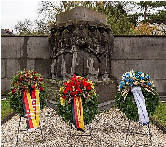
Abb. 4. Denkmal für die Gefallenen von 1914-1918. 37