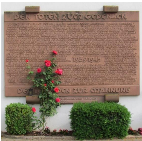
Abb. 5. Gedenktafel für die Gefallenen von 1939-1945. 38