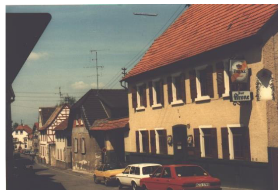
1982, die Brauerei Zur Krone, Backhausstraße Nr. 3. 11