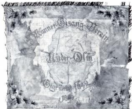
Vereinsfahne des MGW-Liederkranz 1842.

Die alte Fahne des Männergesangsvereins 1842 Nieder-Olm zierte einst eine Schleife mit den deutschen Farben „Schwarz-Rot-Gold“, durch die damals eine freiheitliche und demokratische Gesinnung symbolisiert und demonstriert wurde. Im Vormärz waren die Sänger- und Turnerbewegung von Anfang an national orientiert. Doch die Gesangsvereine waren nicht wie die Turnvereine von Restriktionen und Verboten betroffen. Über die Organisation großer überregionaler Sängereisen wurden die Idee einer deutschen Kulturnation und das Ziel der nationalen Einheit wachgehalten.