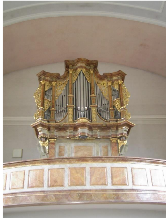
Orgelprospekt in St. Georg.

weitere 42 Jahre bis zu seinem Tod - zunächst 18 Jahre als Lehrer an der Volksschule, dann 23 Jahre als Lehrer seiner eigenen Privatschule. Der leidenschaftliche Musiker übte bis 1860 das mit der ersten Lehrerstelle verbundene Organistenamt an der katholischen Pfarrkirche Sankt Georg aus.