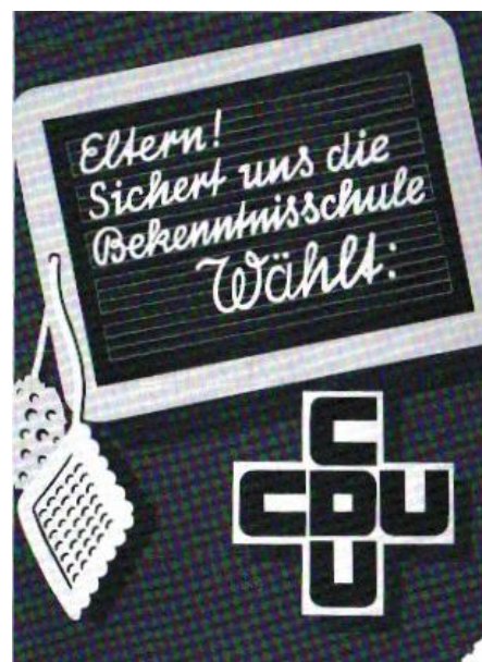
Wahlplakat der CDU aus dem Jahr 1955 zur Schulfrage.

Schulkrieg 1953, Flugblatt der katholischen Bewegung für die Konfessionsschule.