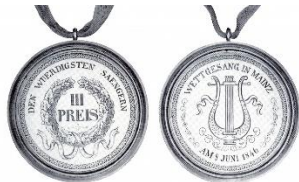
1846, dritter Preis beim Wettgesingen in der Mainzer Fruchthalle.