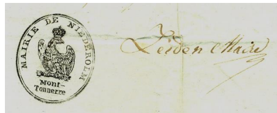
1812, Signatur von Maire Franz Jakob Leiden. 2