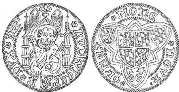
Abb. 1: Nieder-Olmer Weißpfennig.