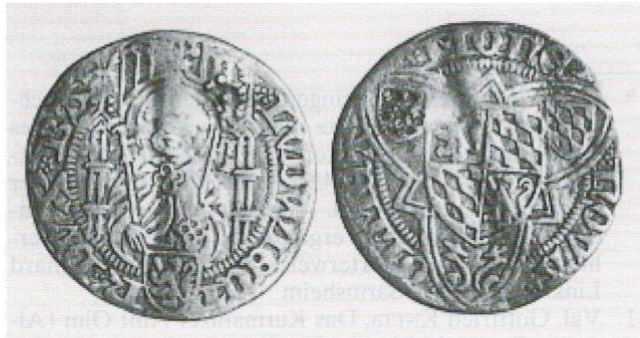
Abb. 2: Münze der Staatlichen Münzsammlung München.

Bislang war man in der Fachliteratur der Meinung, es sei nur ein einziges Exemplar erhalten geblieben, das in der Staatlichen Münzsammlung München auf- bewahrt wird. Inzwischen sind jedoch um 1957 bei einem großen Weißpfennig-Fund in Köln drei wei- tere Nieder-Olmer Münzen aufgetaucht 8 . Vergleicht man die Details der Münzbilder, so ergibt sich, dass die vier erhaltenen Weißpfennige unter Verwendung unterschiedlicher Prägestempel geschlagen wurden. Sie sollen nun vorgestellt werden: