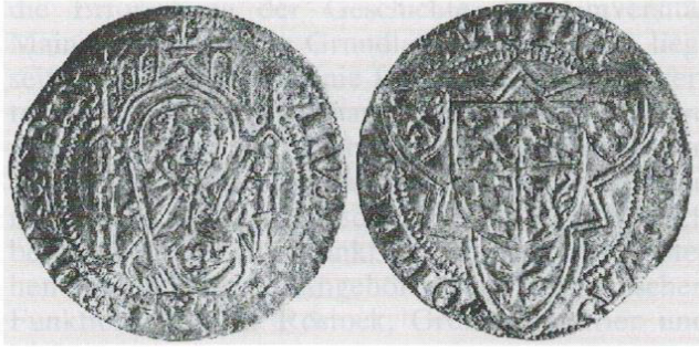
Abb. 5: Im Jahre 1983 versteigerte Münze.

Schreibweise des Prägeortes auf der Umschrift der Rückseite: OLME.