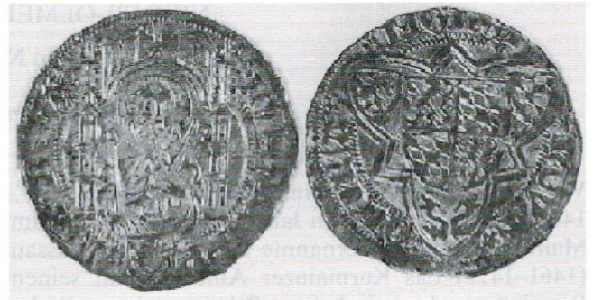
Abb. 3: Münze A des Rheinischen Landesmuseums Bonn.

Zwei dieser Weißpfennige gelangten in das Rheini- sche Landesmuseum Bonn 11 .