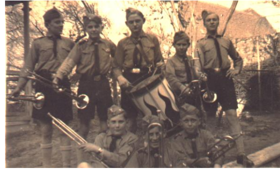
Der Nachwuchs, HJ-Fanfarenzug Nieder-Olm. 65