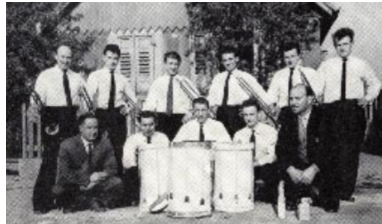
1959, Weckruf am 1. Mai. 99

Im Jahr 1959 fanden sich einige junge Männer zusammen, um einen Fanfarenzug ins Leben zu rufen, wie die Vereinschronik von 1969 vermerkte. Einige hatten bereits musikalische Erfahrungen aus den NS-Jugendorganisationen der 1930er Jahre. 98 In der Nachkriegszeit fand dies jedoch zunächst keinen großen Anklang, da Trommeln und Fanfaren an die unselige Zeit des Dritten Reiches zwischen 1933-1945 erinnerten. Unterstützung fanden sie jedoch durch den nach 1945 wiedergegründeten Männergesangsverein Liederkranz 1908 e.V., der den neuen Musikzug in seinen Verein unter dem Namen Fanfarenzug des MGV Liederkranz 1908 e.V. integrierte. 1960 entschloss man sich einen selbstständigen Verein zu gründen, der sich nun Freier Fanfarenzug Nieder-Olm nannte. Erste Auftritte erfolgten durch den alljährlichen Weckruf am 1. Mai in den Straßen der Gemeinde. Bald konnte man sich vergrößern und an Wettbewerben teilnehmen.