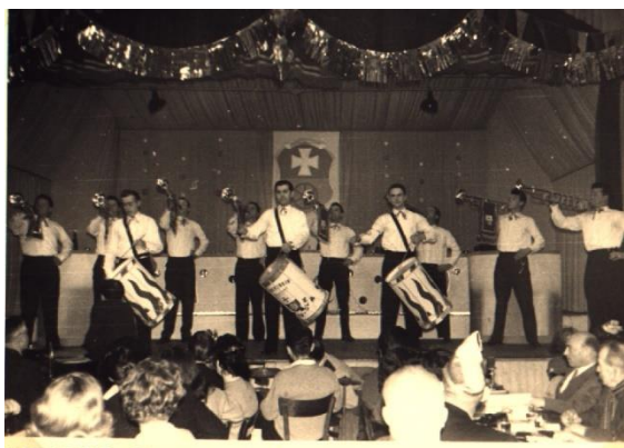
1959, Fanfarenzug in der NOCC-Fastnachtsitzung. 101

Anfang der 1970er Jahre wurde allmählich ein zeitgerechtes Konzept umgesetzt, um die zahlreichen Musikstücke vielfältiger und anspruchsvoller gestalten zu können. 1981 erfolgte die Umbenennung in Musikfreunde Olmenos . Das Repertoire wurde in den Bereich der anspruchsvollen Unterhaltungsmusik, wie Oldies, Tanzmusik aus aller Welt und diverse Medleys angelegt. Aber auch konzertante Stücke mit anspruchsvollen Arrangements kamen zur Aufführung.