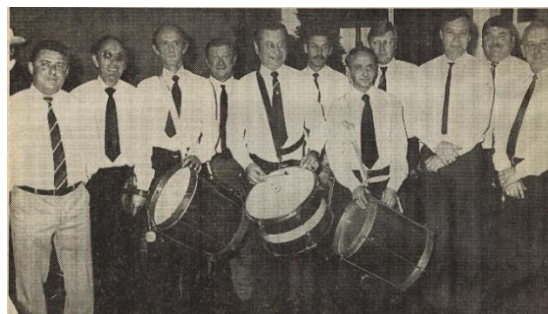
1984, Wiedertreffen der Gründungsmitglieder der Musikfreunde Olmenos zum 25-jährigen Bestehen. 105