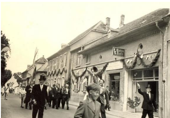
1959, Festumzug zum großen Gauturnfest in der Pariser Straße, unter Begleitung der Vereinigten Musikkapelle . 78