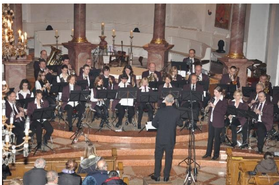
2010, Adventskonzert in St. Georg. 96