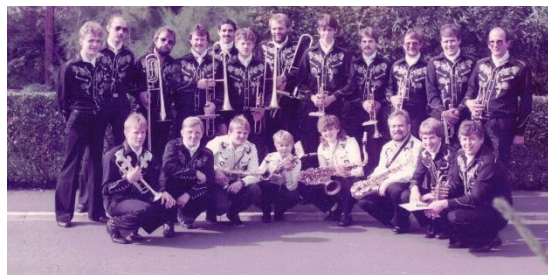
1984, Musikfreunde Olmenos . 106