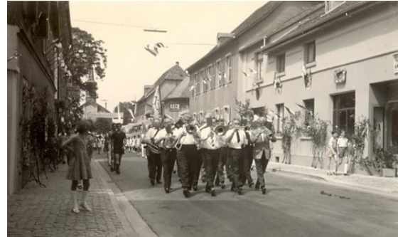
1961, Festumzug 75 Jahre Freiwillige Feuerwehr Nieder-Olm, der von der Vereinigten Musikkapelle in der Pariser Straße angeführt wurde. 79