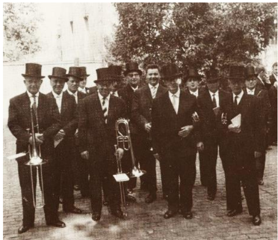
Ende der 1960er Jahre, Mitglieder der Vereinigten Blaskapelle .