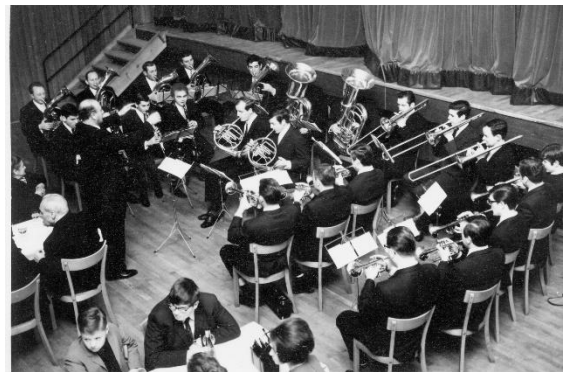
1960/1970er Jahre. Bunter Abend in der alten Festhalle. 91

sionen, Begleitung der Erstkommunionkinder am Weißen Sonntag, die Kerb im Pfarrhof, das festliche Musizieren vor der Christmette, die Mitwirkung am Volkstrauertag und an Allerseelen auf dem Friedhof, die Mitgestaltung von Vereinsjubiläen, das Straßenfest und die Fortführung der alten Tradition des Weckrufs am 1. Mai. Ab 1972 veranstaltet der Bläserchor sein weit über die Grenzen Nieder-Olms bekanntes Sommernachtsfest. Seit 1974 umrahmt der Bläserchor auch die Fastnachtssitzungen in Nieder-Olm und der näheren Umgebung. Das Repertoire des Bläserchores reicht von kirchenmusikalischen Werken, über klassische Bläasersätze, traditionelle Blasmusik, Tanzmusik, Operette, Musicals bis hin zu aktuellen Hits". 90