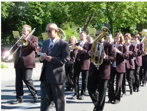
2010, Fronleichnamsprozession. 94