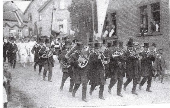
1920, die Blasmusikkapelle Michael Eifinger III. begleitet die Prozession in der Ernst-Ludwig-Straße.

Die Prozession wurde von der Musikkapelle Michael Eifinger III. angeführt. Ihr folgten der Jungfrauenverein und die Marienkinder mit der Marienfahne.