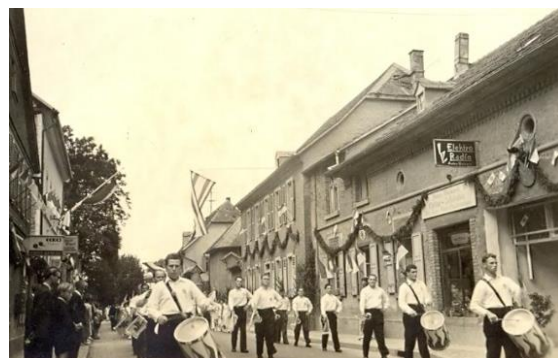
1959, Festumzug, Gauturnfest in Nieder-Olm. 100