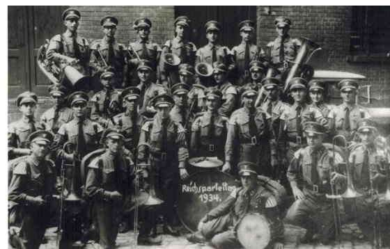
1934, die vereinigte NS-PO-Musikkapelle nahm in NS-Amtswalteruniformen am Reichsparteitag in Nürnberg teil. 60