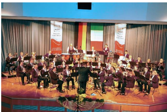
2013, Jahreskonzert. 97