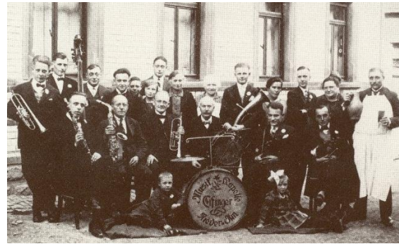
1929, Blasmusikkapelle Michael Eifinger III.