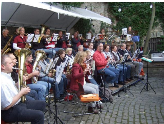
2010, Hofkerb im Anwesen des Pfarrhauses. 95