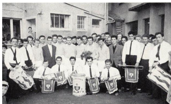
Der Fanfarenzug spielte anlässlich der Meisterschaft des FSV in der 2. Amateurliga, Spielsaison 1961/62. 104