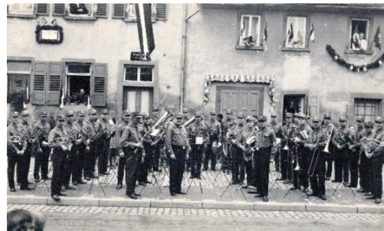
1933, Erntedankfest, die vereinigte NS-PO Kapelle spielte in SA-Uniformen auf dem Marktplatz, umbenannt in Horst-Wessel-Platz. 59