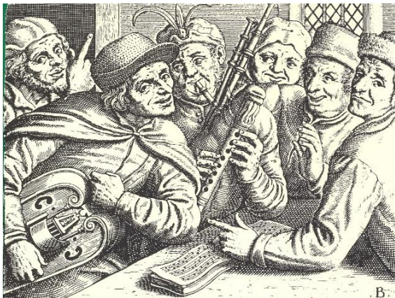
Musikanten 1593. 4

Erst mit Beginn des 18. Jahrhunderts lässt sich in Nieder-Olm das Auftreten von Musikanten schriftlich belegen. Einen ersten konkreten Hinweis findet man im Jahr 1708 zur Kirchweih , als