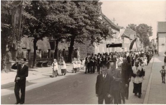
1950er Jahre, Fronleichnamsprozession mit der Vereinigten Musikkapelle . 76