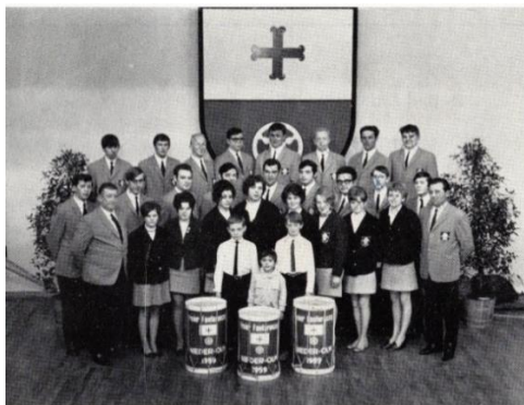
1969, zehn Jahre freier Fanfarenzug. 103

Durch die unzähligen öffentlichen Auftritte im Nieder-Olmer Jahresgeschehen, sowie den erlebnisreichen Gastbesuchen in den Partnergemeinden von Nieder-Olm, wurde aus dem einstigen traditionellen Fanfarenzug eine feste Institution in der musikalischen Welt von Nieder-Olm. Wegen fehlendem Nachwuchs löste sich 2021 jedoch der Musikverein auf. 102