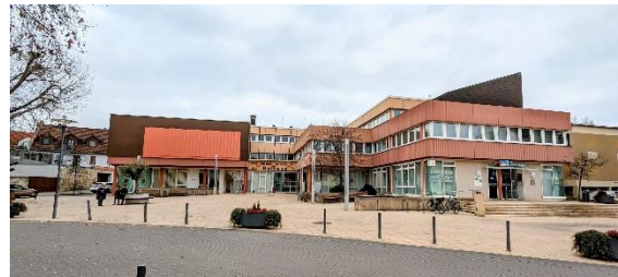
Das 1977 neu gebaute Rathaus für die Verbandsgemeinde- und Stadtverwaltung Nieder-Olm.

Zwischen 1965 und 1972 kam es in Rheinland-Pfalz zu einer Funktions- und Gebietsreform mit dem Ziel zur Einrichtung von Verbandsgemeinden. In Nieder-Olm wurde 1972 so die Verbandsgemeinde Nieder-Olm mit sieben Gliedgemeinden gegründet. Zunächst war deren Verwaltungssitz noch im alten Rathaus angesiedelt, bis man 1974 mit dem Bau eines neuen Rathauses in der Stadtmitte begann, das 1977 bezogen wurde. Neben der Verbandsgemeindeverwaltung etablierte sich dort nun auch die Gemeindeverwaltung, seit 2006 Stadtverwaltung von Nieder-Olm.