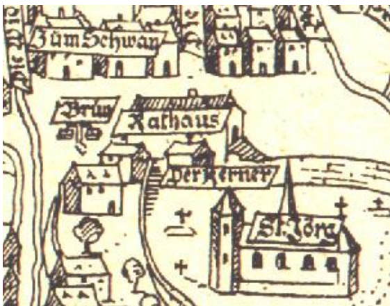
1577, das erstmals 1492 erwähnte mittelalterliche "Clafhus", das Rathaus, an der Ecke Pariser Straße-Backhausstraße.

Ab 1492 wird das mittelalterliche Rathaus als festes Bauwerk genannt, das sich an der Ecke Pariser Straße-Backhausstraße befand, wie es im Ortslageplan von 1557 des Kartographen Gottfried Mascop zu finden ist.