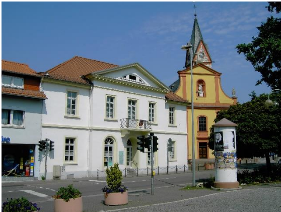
Das alte Rathaus von 1827.

Mit Beginn der großherzoglich-hessischen Zeit ab 1816 begannen langjährige Bemühungen des Gemeinderats zur Errichtung eines neuen Rathauses. Die Gemeinderatssitzungen fanden in dieser Zeit wechselnd in einem der Gaststätten mit Saalbau statt. Es sollte bis 1827 dauern bis ein neues Rathausgebäude endlich realisiert werden konnte. Der Neubau des Rathauses an der Pariser Straße im klassizistischen Baustil entstand vermutlich nach der Planung des hessischen Landbau-meisters Friedrich Schneider, der in den 1820er und 1830er Jahren in der Provinz Rheinhessen aktiv war.