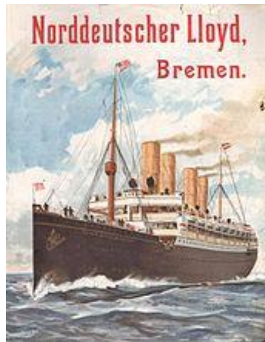
Dampfschiff Norddeutscher Lloyd, Bremen. 1