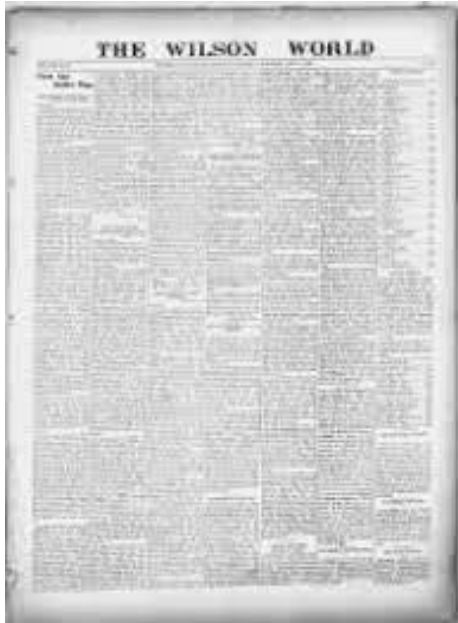
The Wilson World. 2